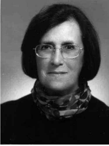
TANSI ŞENYAPILI 1938, 24 Şubat 2023, Ankara