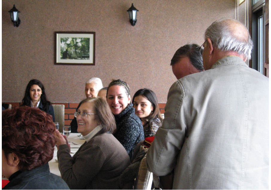
Vişnelik'te emeklilik kutlaması: 03.01.2008