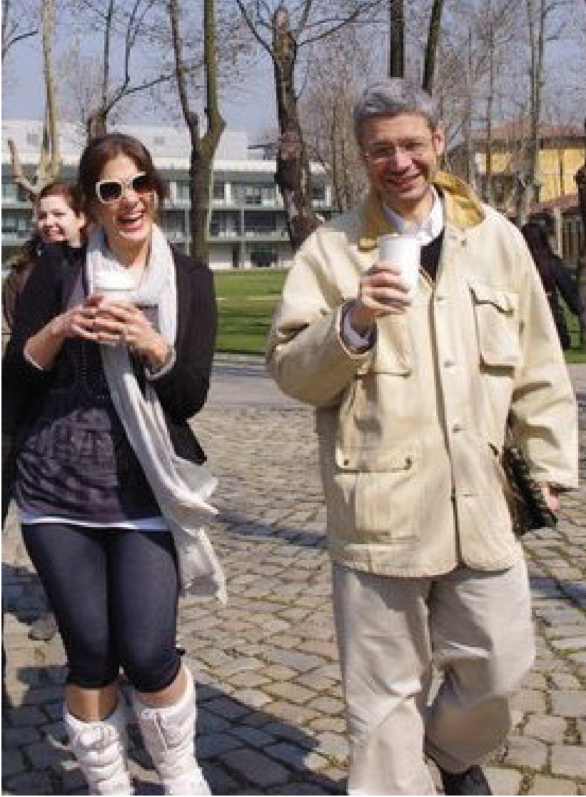
Üçüncü sınıf stüdyo gezisinde, öğrencileri ile, Santral İstanbul, 2011

Erkin'in kişiliğinin özgün yönleri, eğitimciliğine de benzer bir çeşitlilikte yansırı. Fakültede, içinde olmaktan en keyif aldığı ortam stüdyo diye düşünürdüm. Üçüncü sınıf stüdyosunun ayrılmaz parçası oluşunu, tasarım stüdyosu ve öğrencilerini çok seviyor oluşunu, öğrencileriyle yakından ilgilenen bir eğitimci oluşunu, tasarım stüdyosu hocası sorumluluğunu her yönüyle en üst düzeyde ve ilkeli bir biçimde yerine getiriyor oluşunu, seçtiği proje konuları çerçevesinde öğrencilerini hem kuramsal hem güncel meseleler üzerine düşünmeye teşvik edişini, her zaman yaratıcı konular, farklı disiplinlerden hocalar ve uzmanlarla stüdyosunu zenginleştirmeye özen gösteriyor oluşunu gözlemlerdim. Disiplinlerarası bir bakışı stüdyosuna