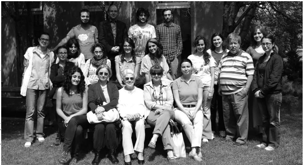
Fahrettin Çetin arşivi; ODTÜ Mimarlık Fakültesi, 2012.

Koruma konusunda çok sayıda yayını ile uygulamaları olup bunları bir araya getiren bir yayını çok faydalı olacaktır. Vakıflar ve Kültür Bakanlığı'ndaki deneyimleri, Cumhuriyet Dönemi eserleri üzerindeki çalışmaları, uygulamaları, yayınları kültürel varlıklarımızın koruma tarihinin yazılmasına yardımcı olacak değerdedirler. Tabi ki herkesin takdir ettiği eğitici yeteneği de öğrencileri tarafından her fırsatta vurgulanmaktadır. Nitekim Emre bunun unutulmaz bir örneğini geçen yıl Milas arazi çalışması sırasında Beçin Kalesi'nde bize vermişti. Çok erken kaybettiğimiz Emre çok önemli bir kayıptır. O sık sık anılacaktır. Başımız sağ olsun. Nur içinde yatsın.