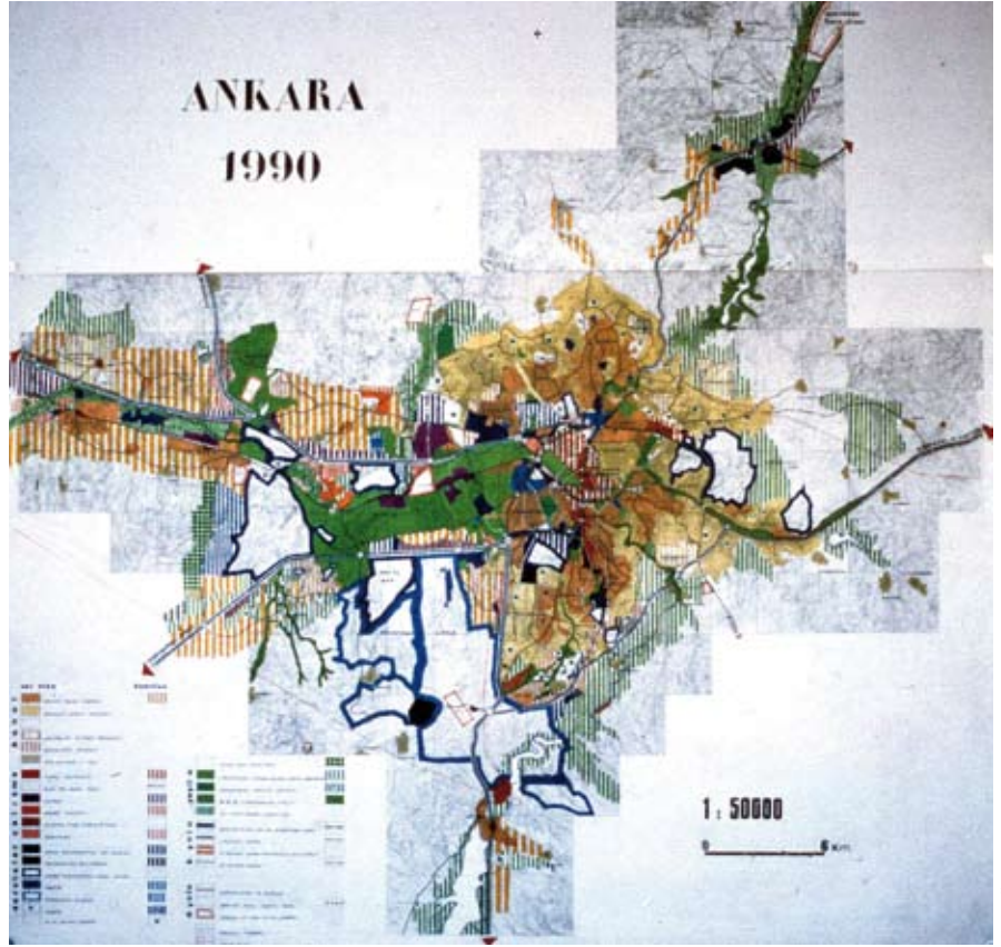
ODTÜ Mimarlık Fakültesi, Harita Plan Belgeleme Birimi; 1/50000 ölçekli 1990 Ankara Nazım Planı.

Kararname'nin birinci maddesi, İstanbul, Ankara ve İzmir kentlerinin planlarının yapımını, İmar ve İskan Bakanlığı'na görev olarak veriyordu. İkinci maddesi, bu amaçla kurulacak büroların harcamaları için, İller Bankası'ndaki bir havuza belediyelerin katkıda bulunacaklarını belirtiyor ve kanımca en önemli hüküm olarak, kurulacak büroların özerk olacaklarını söylüyordu. Üçüncü madde ise, Bakanlığın uygulamalar için yasa önerisi getirebileceği hükmünü taşıyordu. Bu Kararname uyarınca önce İstanbul, sonra Ankara ve daha sonra İzmir Nazım Plan Büroları kuruldu. Ben göreve 1968 Mayıs'ında çağrıldım.