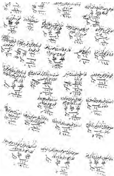
Resim 4. Onarım keşfi altında Elhac Ahmed Ağa'nın mührü ve imzası (BOA. CEVDET MALİYE 28211).