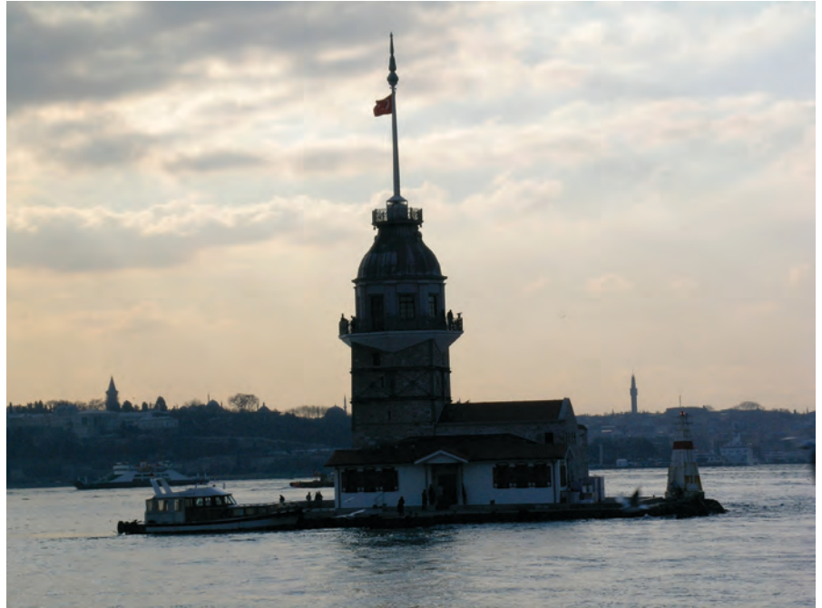
Resim 10. Ekim 2000'de lokanta ve kafe olarak hizmete açılan Kız Kulesi (Mazlum, 2007).

verilen bu gravürde, kuzey duvarının alt kesiminde üç top mazgalı gösterilmiştir. Mehmed Tahir Ağa'nın gerçekleştirdiği 1764 onarımı sırasında eklenen çatı, köşelerde yer alan ve aynı onarımda yenilenen mermer sütun palamarlar gravürde net bir biçimde görülmektedir. Ancak, onarım keşfinden sundurma çatıdan söz edildiği halde, burada topuz çatı gösterilmiştir ve üzeri örtülen top avlusunun doğu yönünde yükselen baca, burada bir ocak yapıldığını da düşündürmektedir.