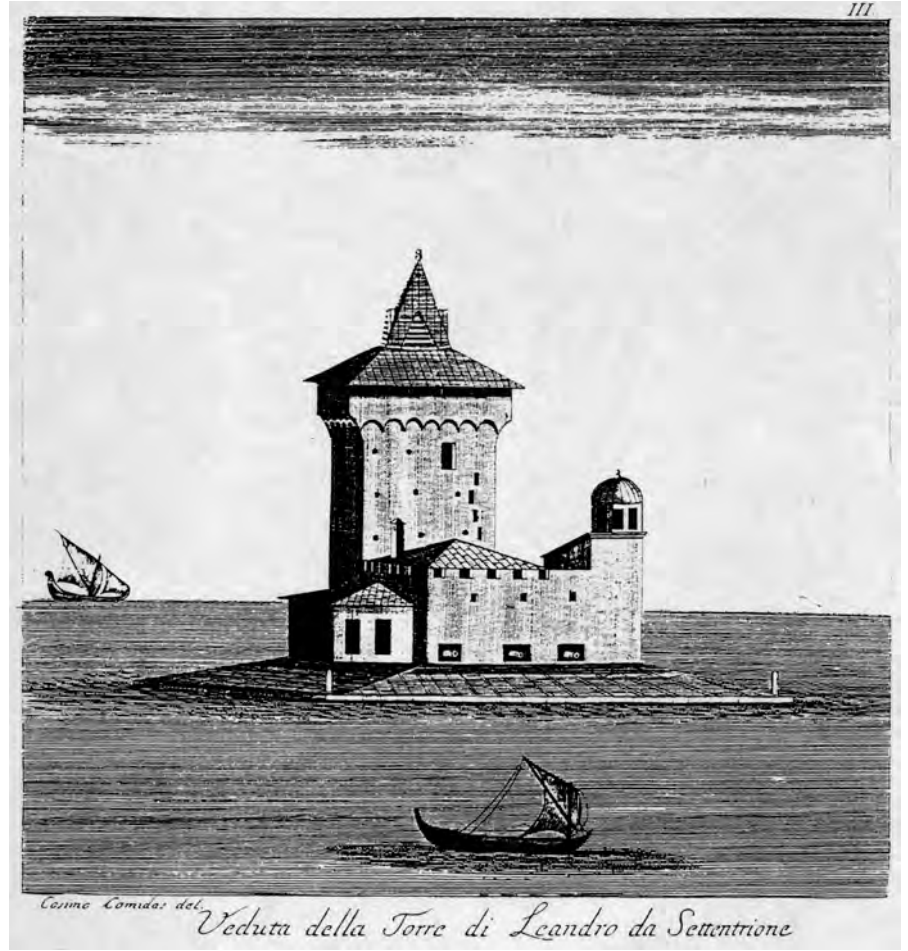
Resim 8. C. C. De Carbognano'nun 1760'larda yaptığı gravür.

ayırt etmek için yapıldığı sanılan kırmızı çizgiler, çizime renk ve hareket katmıştır. 11 sıra taş ve iki sıra tuğladan oluşan duvarın üstünde 11 adet dendan gösterilmiştir.