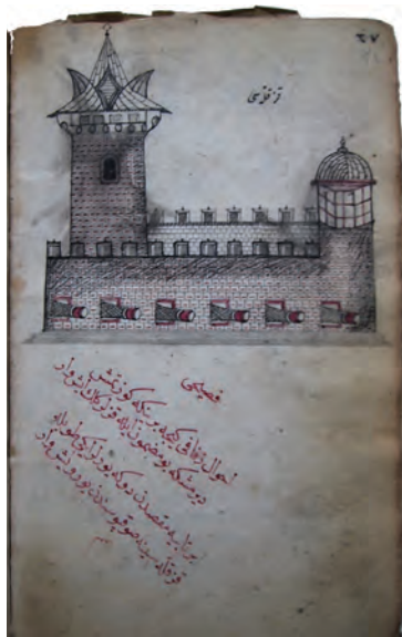
Resim 7. 18. yüzyıl başında derlenmiş bir mecmuada yer alan Kız Kulesi resmi (Süleymaniye Kütüphanesi, Ali Nihat Tarlan Yazmaları, 182).