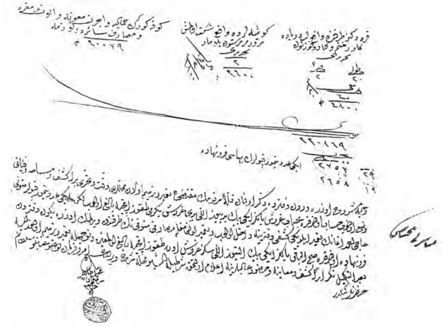
Resim 6. Onarım keşfi altında, "iki adet demir kapıların bahası (nın) fütü-nihade" olduğuunun (genel toplamdan düşürüldüğünün) belirtildiği bölüm ve Mehmed Tahir Ağa'nın mührü ile imzası (BOA. CEVDET BELEDİYE 4117).

Elhac Selim'in imzasını taşıyan bu belgede, bu kez, gerçekleştirilmekte olan bir onarımın ödemeleriyle ilgili bir sıkıntı dile getirilmektedir. Başmimar, onarmakla görevlendirildiği Kız Kulesi için "canib-i miriden henüz akçe ita olunmadığı" nı bildirmekte, amele ücretleri ve diğer masraflar karşılığında ödeme yapılmamasının "tatil-i umur" a (işlerin durmasına) yol açmaması için 3 000 kuruş ödenmesini istida etmektedir. Ertesi gün verilen tezkirede, "bu defa" 1 500 kuruş verileceği bildirilmiştir.