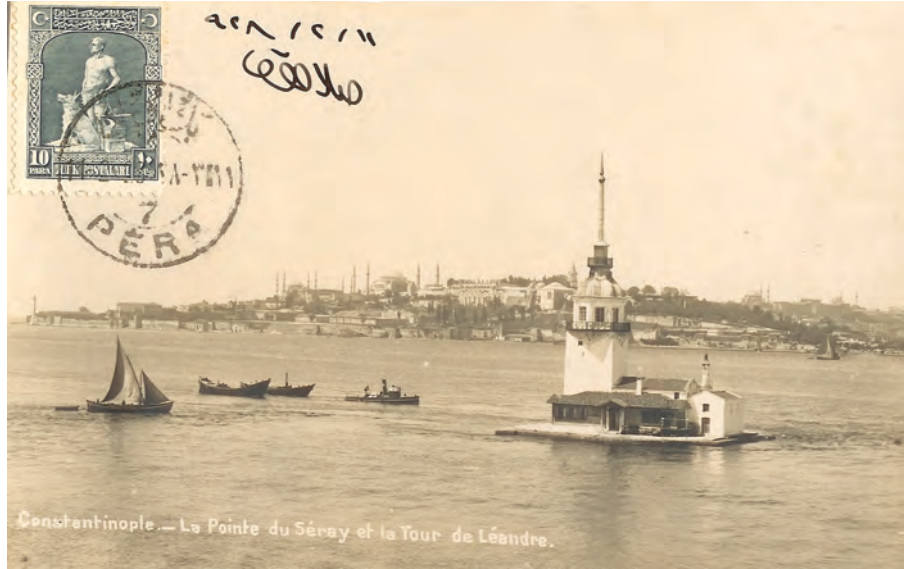
Resim 9. Kız Kulesi'nin 1920'lerdeki durumu.