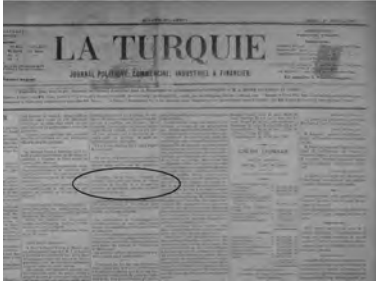
Resim 1. Bir İngiliz'in Kız Kulesi'ni 12 yıllığına kiralamak istediğini aktaran gazete haberi (La Turquie'nin 1 Nisan 1880 tarihli nüshasının 1. sayfası).

Turquie' nin 26 Temmuz 1883 tarihli nüshasında, Kız Kulesi'nin onarıma çok muhtaç bir durumda bulunduğunu bildiren haberden anlaşılıyor. Ancak, Fransa sefirinin Kız Kulesi'nde bir davet vermeye hazırlandığını ortaya koyan belge, 19. yüzyıl sonunda yapının çok özel konumu nedeniyle gözde bir ağırlama mekanı olarak algılanmaya devam ettiğini de gösteriyor (3).